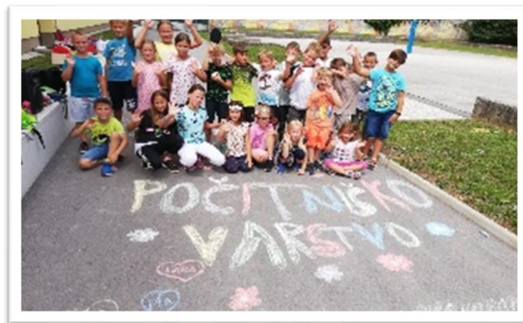
Slika 2: Otroci med poletnim počitniškim varstvom

❖ TEDEN OTROKA® - je bil realiziran po programu za otroke iz Občine Domžale, v prvem tednu v oktobru 2021, od 4. 10. – 10. 10. 2021.