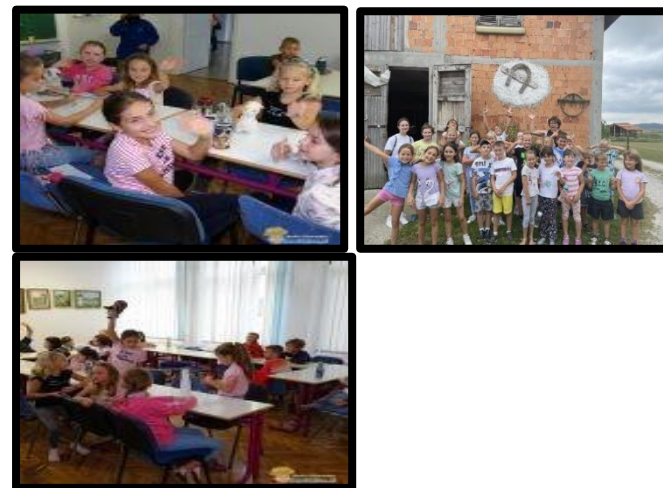
Otroci med poletnim počitniškim varstvom